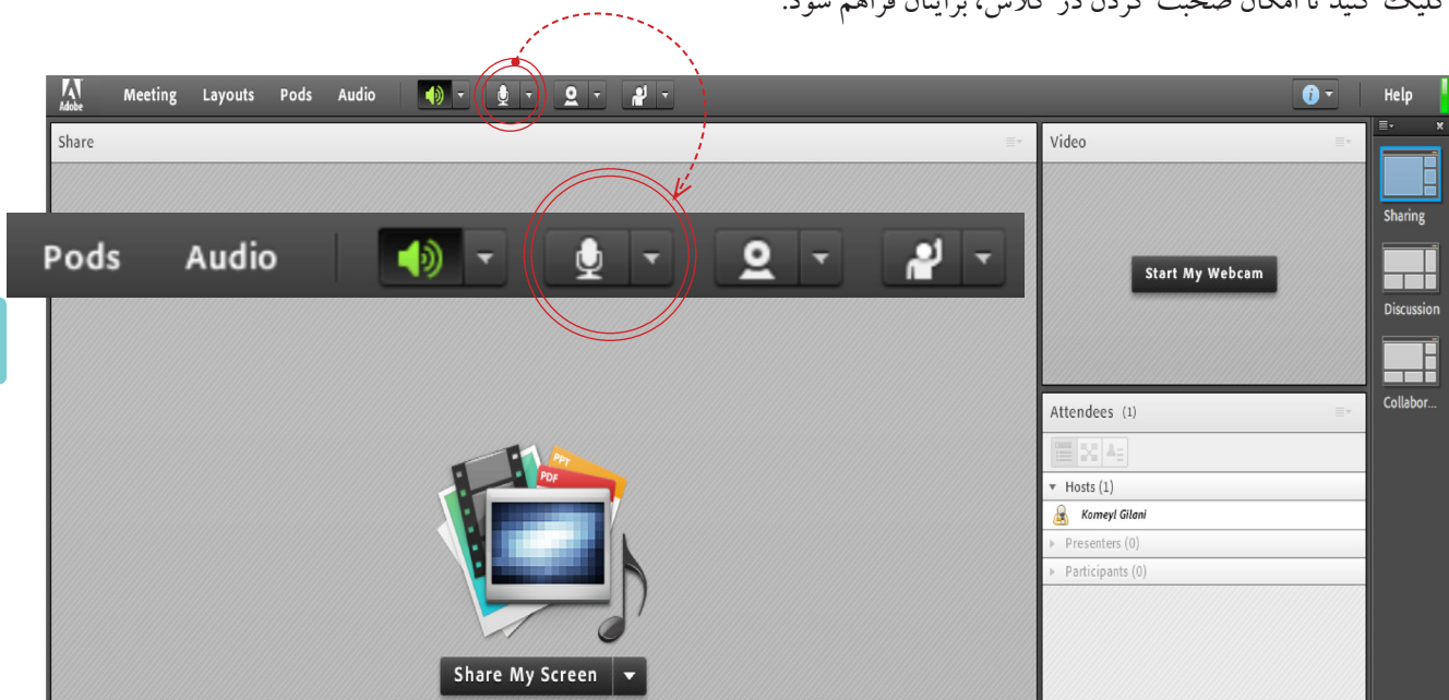
تصویر شماره ۳ - فعال سازی میکروفن

پس از چک کردن تنظیمات مربوط به صدا (راهنمایی بیشتر در صفحه ۱۰ تا ۱۲)، روی علامت میکروفن در قسمت میانی بالای صفحه کلیک کنید تا امکان صحبت کردن در کلاس، برایتان فراهم شود.